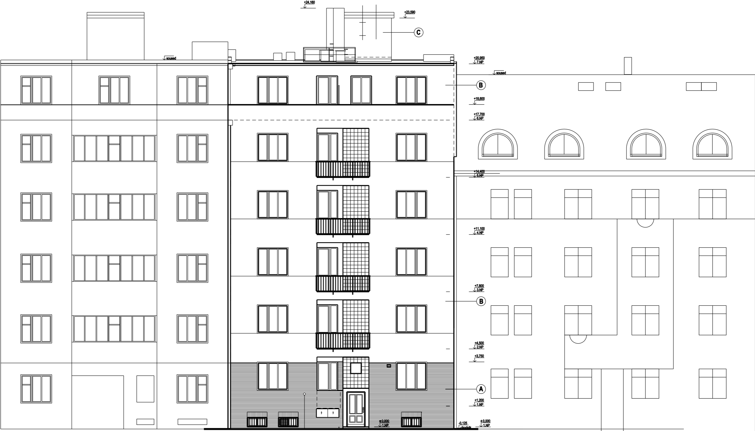
VRŠOVICKÁ Č.P. 834/10